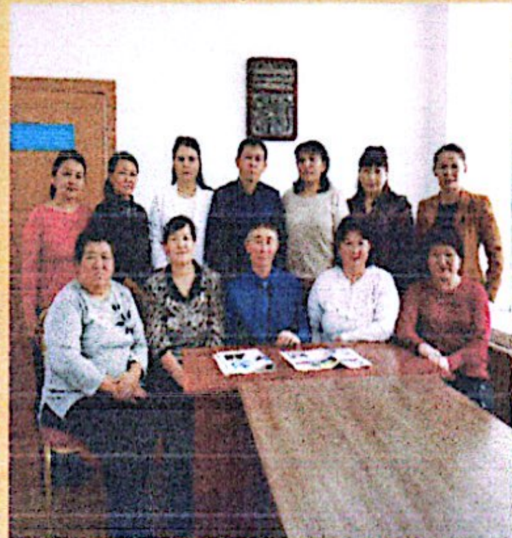
Шығыс Қазақстан облысы, Тарбағатай ауданы, Ақсар ауылы "Абай атындағы орта мектеп" коммуналдық мемлекеттік мекемесінің ұстаздары